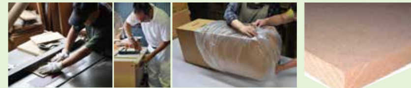
ひとつひとつ手作りで国内で作られています。